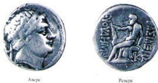
Царь Евтидем I (222-187 гг. до н. э. ).