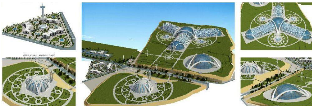
Рис. 15. Музейный комплекс под открытым небом над городищем Ахсикент

Проект предусматривает автомобильные стоянки, ветряные электростанции для автономного питания и создания микроклимата в различные времена года, электронной библиотеки, визит-центра обслуживающий посетителей, гостиницы, канатную дорогу, а также лекционные залы и учебные классы. В учебных классах посетители смогут попробовать заняться традиционными ремеслами жителей, населявших Ахсикент (изготовление глиняной посуды, изготовление булатных мечей и др.). Посетители также будут иметь возможность принять участие в археологических раскопках, проводимых на территории музея заповедника, а также посетить музеи в том числе и посвященный древним монетам Ахсикента.