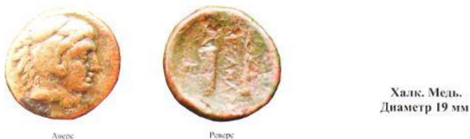
Рис. 1. Медная монета Империи Александра Македонского (326 – 323 гг до н.э.)

Первый период денежного обращения (Античный период). История денежных обращений в Центральной Азии началась с завоевательными походами Александра Македонского по времени это - IV век до н.э. и можно отнести этот период к Античному продолжавшемуся с 330 года до н.э. и длившемуся до конца 224 года уже н.э. до образования государства Сасанидов. За этот период произошло крушение Парфянского царства, Кушанского государства, падение Парфии. Это был первый период развития денежного обращения (Рис 1, 2, 3).