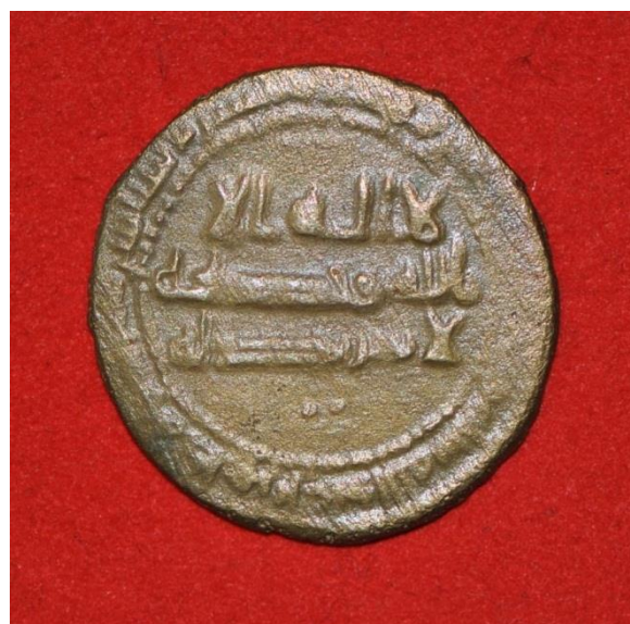
Рис. 13 и 14. Медные монеты (фельсы) чеканившиеся в городе Ахсикент

Данная статья имеет место быть в связи с тем, что диссертация «Основные принципы архитектурно-планировочной организации «Музейного комплекса под открытым небом» (на примере древнего городища Ахсикент в Наманганской области) являющийся магистрантской темой автора статьи, предполагает создание в комплексе архитектурного проекта специального музея, где безусловно будут присутствовать в качестве экспонатов и такие музейные реликвии как приведенные на снимках монеты чеканки древнего города Ахсикент (Рис 15).