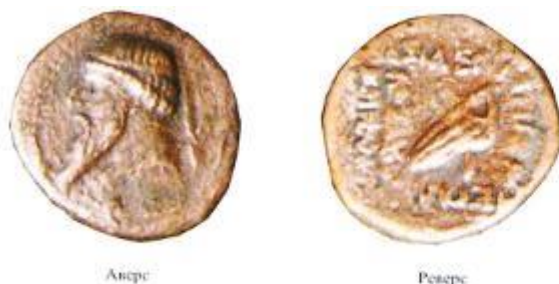
Царь Митридат II (123-88 гг. до н. э.).